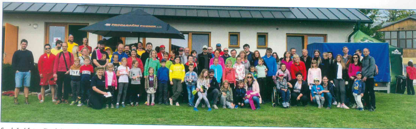
Společné foto při zahájení akce.

Český Krumlov / České Budějovice - Předposlední zářijovou nedělí se ve spolupráci s vodními záchranáři v Dolní Vltavici, na břehu lipenského jezera, konala akce pro zaměstnance Zambelli-technik a jejich rodinné příslušníky.